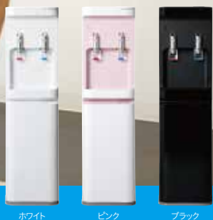
ホワイト ピンク ブラック