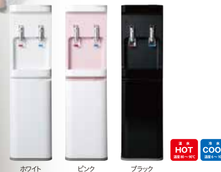
ホワイト ピンク ブラック

※当社従来品「smart」と新製品「smartプラス」との比較。 ※給水汲み上げ時のポンプ作動音を測定。 パナソニック株式会社調べ